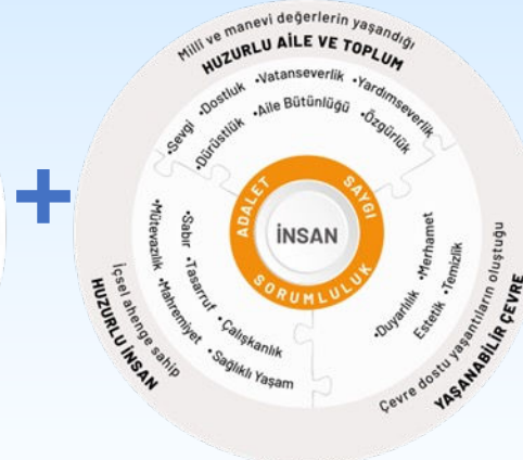
ERDEM DEĞER EYLEM MODELİ